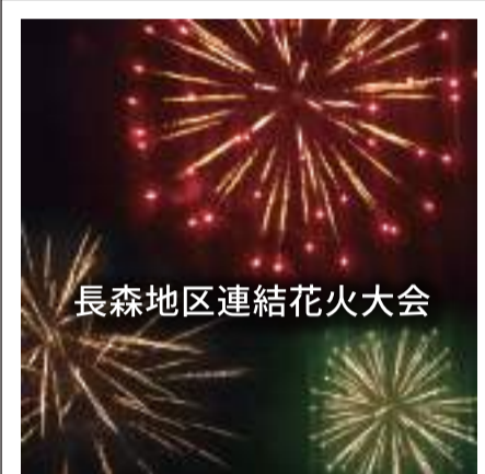
長森地区連結花火大会