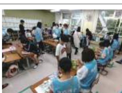
ふれあいフェスティバル