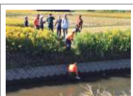
新荒田川清掃活動