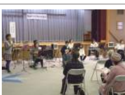
福祉ふれあいの集い

お集りいただいた高齢者の方々に、昭和歌謡などのアンサンブル演奏を楽しんでいただきました。